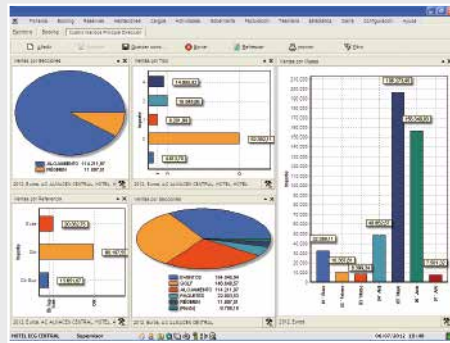
Cuadros de mando