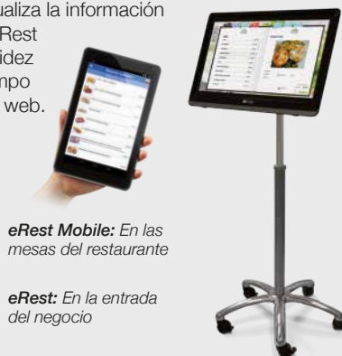
eRest Mobile: En las mesas del restaurante