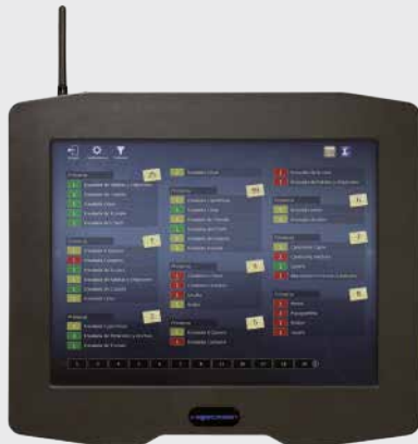
HioScreen controla los platos pendientes de preparar y servir, así como del tiempo pasado desde la solicitud.